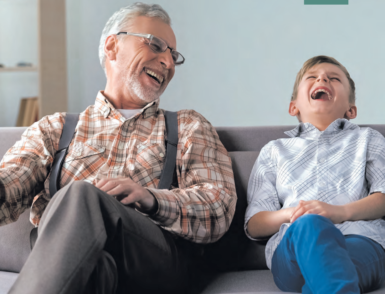
Lachen verbindet und ist erst noch gut für unser Wohlbefinden.