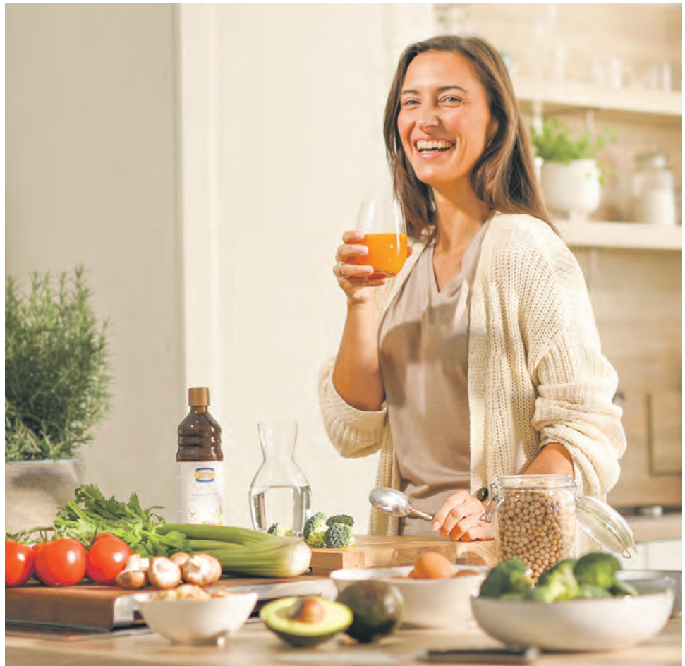
Das Mikronährstoffkonzentrat LaVita wird von vielen Experten empfohlen, um einfach und bequem die tägliche Versorgung mit allen wichtigen Vitaminen und Spurenelementen zu optimieren.